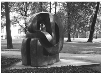
Памятник жертвам Холокоста в г. Пушкине

Более чем через полвека после Холокоста на одной из центральных улиц бывшего Царского Села мы с женой случайно обнаружили памятник, созданный знаменитым Сидуром в его традиционной апокалиптической манере. Вадим Абрамович Сидур, со свойственной нашему брату самоиронией, даже называл художественный стиль некоторых своих инсталляций «гробартом». Он (привет знаменитому прозаику) тоже был воином и инвалидом ВОВ. Вероятно поэтому работы Сидура стали, в целом ряде случаев, памятниками людям, погибшим в военное лихолетье. Одна из них использована как скульптурная основа для монумента, установленного в г. Пушкине. На пьедестале его выбито: «Евреям г. Пушкина, павшим жертвами фашистского геноцида 1941г. ...Пролили кровь их, как воду... и некому было похоронить их».