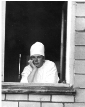
Вид из окна БСМП на окружающую жизнь, которую я созерцаю уже 50-й год.