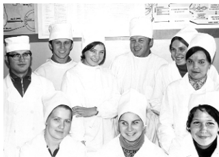
На занятиях со студентами.