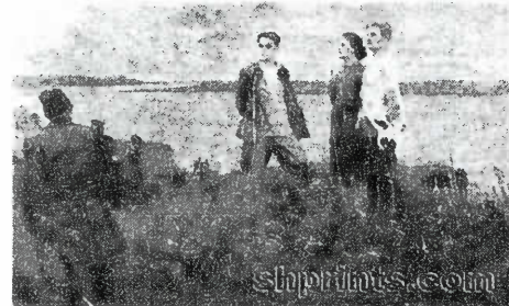
Ю.Кияченко. Трипольская трагедия.

Папа почему-то уехал в Автономную Советскую Социалистическую республику немцев Поволжья в театр концертмейстером (очевидно, в Немогтеатр, открывшийся в 1931 году). Редактировал там стенную газету на немецком языке. Знаю, что у него были большие способности к изучению языков, и он самостоятельно изучил их всю жизнь. Знал не менее пятнадцати, перелел на немецкий "Полтаву" Пушкина. Во время страшного голода (1932-33 года), когда были изъяты у населения все продукты, получал паек, поэтому и выжил. В ноябре 1934 года издается директива о "борьбе с фашистами и их пособниками" среди немецкого населения СССР. Директива дала толчок мощной одноименной репрессивной кампании против советских немцев, в том числе и в АССР НП. По всей видимости, к этому периоду (хотя, возможно, и ко времени войны) относится эпизод с обвинением папы в том, что он "немецкий шпион"! Доводы, о том, что он не может быть немецким шпионом, будучи евреем, не убедили, и тогда папа сказал, что его сестра - герой комсомола. Как ни странно, никто этого проверять не стал, но его отпустили.