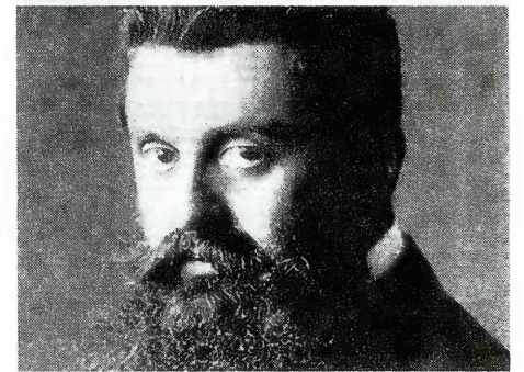
Теодор Герцль - провозвестник еврейского государства

Моше (Хаим) Шапира (1902-1970) - один из лидеров религиозных сионистов, позднее - Национально-Религиозной партии (Мафдаль). Член исполкома Еврейского агентства (возглавлял иммиграционный департамент); активно пытался предотвратить столкновение между Хаганой и Эцелем. Министр Временного правительства, депутат Кнессета (1949-1970), министр абсорбции (1949-50), здравоохранения (1949), внутренних дел (1949-52 и 1959-70), культов (1952-58) и социальной помощи (1952-55).