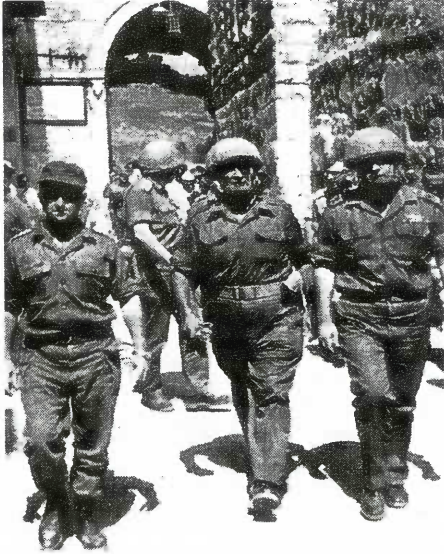
Узи Наркис, Моше Даян и Ицхак Рабин в освобожденном Иерусалиме

Сорок лет назад на Ближнем Востоке началась война, вошедшая в историю под названием Шестидневной. Меньше чем за неделю Израиль разгромил армии трех арабских государств и захватил территорию, вчетверо превышающую его собственную. Именно тогда сектор Газа, Голанские высоты, западный берег реки Иордан и восточная часть Иерусалима попали под власть Израиля. С тех пор все эти территории остаются предметом непрекращающихся споров и конфликтов между арабами и евреями.