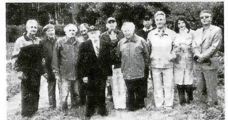
На месте бывшей синагоги