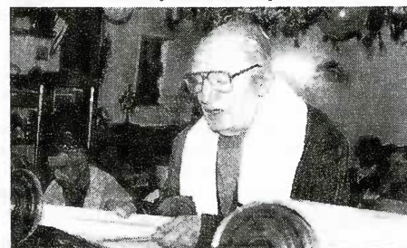
Чтение Свитка Торы