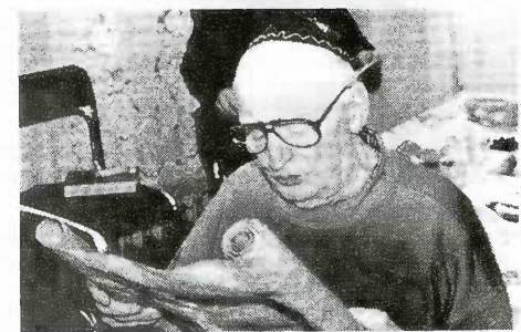
Чтение Мегилат Эстер