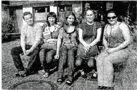
Молодежь в Тюбингене

В Дни трепета между Рош ha-Шана и Йом Кипур - время, когда каждый человек подводит итоги года прошедшего и строит планы на год грядущий. Прошедший год был насыщен многими яркими событиями, некоторые из которых, как нам кажется, останутся в истории нашей общины. К таким событиям можно отнести визит делегации молодежи в Тюбинген. Это первый подобный визит, и есть надежда, что те контакты, которые удалось установить, разовьются, послужат основой для налаживания постоянных взаимоотношений между молодежью нашей общины и общины Тюбингена.