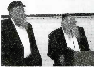
Шая Гиссер и Адин Штейнзальц

В Москве прошел семинар, приуроченный к 20-летию Института изучения иудаизма в СНГ под руководством раввина Адина Штейнзальца. В 14 лекциях, семинарах и дискуссиях, разделенных на два потока, приняло участие почти 230 человек. Спектр обсуждавшихся тем традиционно был весьма широк: от размышлений о еврейской магии до дискуссий о еврейском театре. Как вспоминает директор Института в странах СНГ Давид Палант, когда он приехал в Россию 20 лет назад, рав Адин Штейнзальц сказал ему: "У нас условия для сотрудников не очень. Так было и будет. Но у нас никогда не скудно".