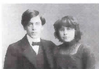
С. Эфрон и М. Цветаева